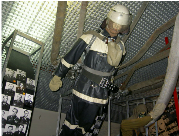
Abb. 5: „Schutzkleidung“ eines Feuerwehrmannes, wie sie im April 1986 zum Einsatz kam.

hier genau die Tatsachen, die dazu führten, dass diese jungen Menschen wissentlich tödlichen Gefahren ausgesetzt wurden. Die bekannten Bilder von Sowjetsoldaten, die, lediglich mit Mundschutz und einfacher „Schutzkleidung“ ausgerüstet, mit bloßen Händen hoch radioaktiv verseuchte Trümmer wegkarrten, sind jedem, der sich mit dieser Thematik auseinandergesetzt hat, in bleibender Erinnerung. Die schätzungsweise 600.000 Liquidatoren wussten über Radioaktivität keineswegs hinlänglich Bescheid; speziell für solche Störfälle waren sie überhaupt nicht geschult. Ihr Einsatz ohne ausreichenden Schutz kann durchaus als menschenverachtende Tat verurteilt werden. Geradezu bizarr ist das Faktum, dass bei der Trümmerbeseitigung Roboter wegen der immensen Strahlung ihren Dienst versagten – sie wurden schlicht durch Liquidatoren ersetzt. 5 Genau dies müsste in der Ausstellung aufgezeigt werden. Es bleibt jedoch im Verborgenen.