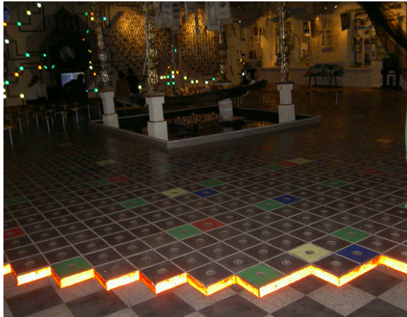
Abb. 7: „Nachgebauter Reaktorkern“ am Ende der Ausstellung. Die beiden runden Objekte im Hintergrund an der Wand stellen ebenfalls Kernreaktormodelle dar, die mit Bildern von Čornobyl'kindern dekoriert sind. Hinten links besteht die Möglichkeit, einen 10-minütigen Dokumentarfilm über die Evakuierungsmaßnahmen anzuschauen.

leuchtung ist das Licht am „Kernreaktor“ im unteren Bildausschnitt sowie die im Hintergrund der Aufnahme befindlichen Lämpchen, welche die Kontrolllampen eines Kraftwerks darstellen sollen.