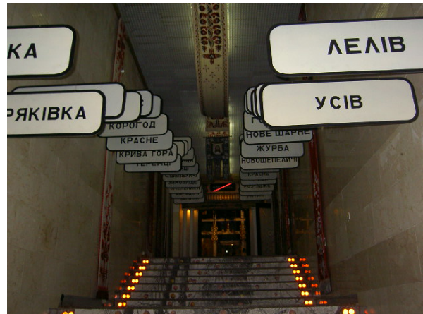
Abb. 2: Eingang zur Ausstellung. In der Mitte an der Decke ukrainische Teppiche mit religiösen Motiven. Die Ortstafeln zeigen evakuierte Ortschaften in der heutigen Sperrzone. 2

gereist sind, um die Katastrophe in den Griff zu bekommen. Ukrainische Fahnen sucht man allerdings vergeblich. Es sind also traditionelle sowjetische Heldenschemata, wie sie oft beispielsweise in osteuropäischen Weltkriegsmuseen besichtigt werden können, feststellbar. Dieses klassische sowjetische Heldenschema findet hier also eine späte Anwendung. Dass die Mitglieder dieser „Freiwilligentrupps“, ohne im Umgang mit Radioaktivität in irgendeiner Weise geschult worden zu sein, oft sinnlos „verheizt“ wurden, wird hier ebenfalls nicht deutlich.