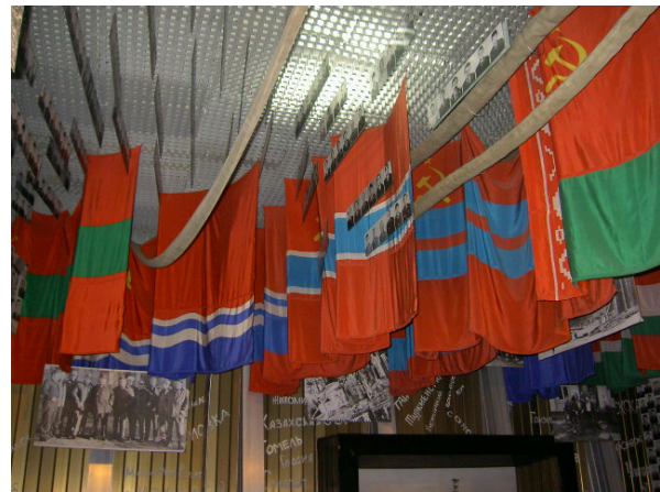
Abb. 3: Fahnen sämtlicher ehemaliger sowjetischer Teilrepubliken.