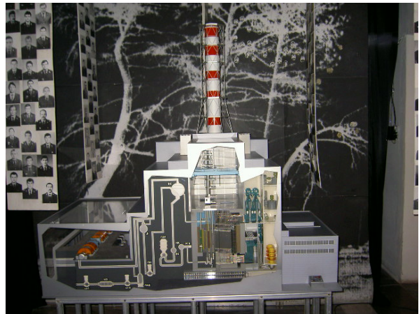
Abb. 4: Schematische Darstellung des Reaktorblocks.

Die einzige schematische Veranschaulichung der AKW-Konstruktion zeigt Abbildung 4. Allerdings ist auch sie stark vereinfacht und gibt keinerlei Auskünfte über Mängel oder Ursachen der Havarie. Ebenfalls ist dieses Modell nicht etwa in einer speziellen „Technik-Ecke“ der Ausstellung untergebracht, sondern nahtlos eingebettet in das Gedenken an die „Helden“, da sich z.B. im Bildhintergrund links die im ganzen Haus zahlreich eingesetzten Werksphotographien der Arbeiter und Feuerwehrmänner befinden.