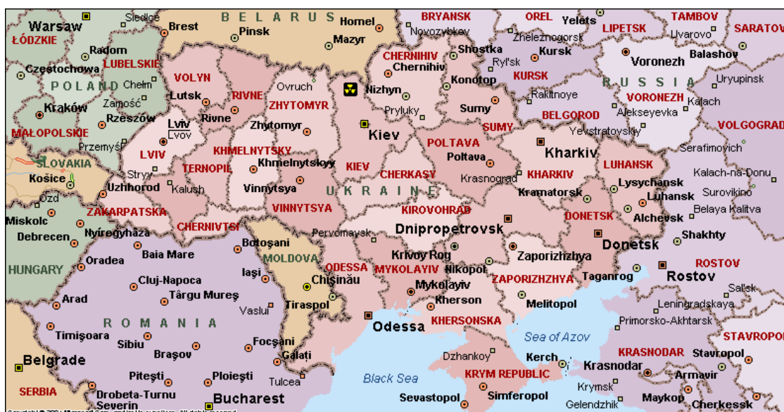
Abb. 1: Ukraine; Das AKW Čornobyl' befindet sich rund 110 km nördlich der Hauptstadt Kyiv; Quelle: Microsoft AutoRoute 2005.