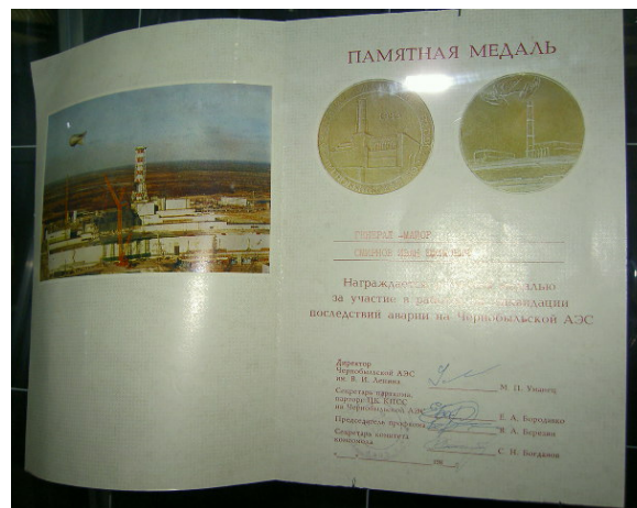
Abb. 6: Pamjatnaja Medal' – Gedenkmedaille für einen Generalmajor. Die Urkunde ist von der Kraftwerksleitung sowie weiteren Parteifunktionären unterzeichnet.

aufgrund ihrer Strahlenschädigungen verstorben sein.